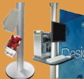
porta deplianti A4 verticale