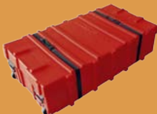
contenitore flat pack dimensioni: 73x140x25/35 cm