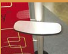
pianetto esterno rettangolare